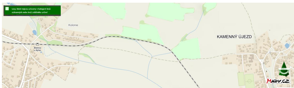
Obr. 2. Znázornění kategorie lesa – k.ú. Kamenný Újezd u Nýřan, Blatnice